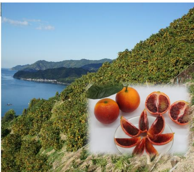
耕して天に至りそうな急傾斜

ブラッドオレンジ栽培部会では、東京、大阪で開催されるアグリフード EXPO などの商談会や高級デパートでの販促活動の他、導入されて年数が浅いため、栽培技術や貯蔵技術などの技術を確認する他、加工でも重宝されているため、新たな加工技術や加工製品の開発などに取り組んでいます。