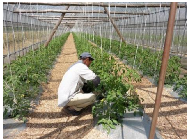
【一日のライフスタイル（一例）】